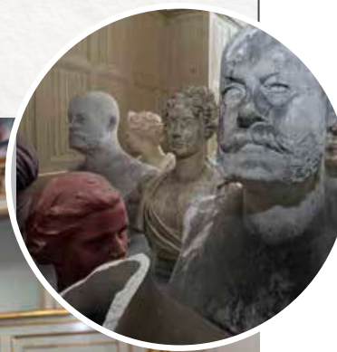
Auf zwei Etagen des Residenzschlusses vollzieht sich ein bildreicher Kampf der Exponate gegeneinander.

dern würden. Die Idee ist simpel und spiegelt sich bereits im Namen der Kunstaktion wider – die Exponate intrigieren, brechen aus dem Magazin aus und überfluten den Goldsaal. Aufgetürmte und scheinbar willkürlich abgestellte Ausstellungsstücke wie Möbel, Bilder und andere, teils nicht restaurierte Gegenstände verwandeln den Goldsaal in ein wahres Wimmelbild. Die Besucher werden dazu eingeladen, sich im Zick-Zack durch das Chaos zu kämpfen und auf Entdeckungstour zu gehen. Dabei wartet auch die eine oder andere Überraschung auf die Gäste: Inmitten des Chaos sitzt beispielsweise Herzog Ernst II. an einem Tisch und unterzeichnet die Schenkungsurkunde von 1943, mit der das Schloss in den Besitz der Stadt Altenburg überging.