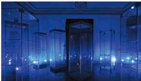
Vor dem Eintritt in den Goldsaal erwarten die Besucher beeindruckende Lichteffekte.