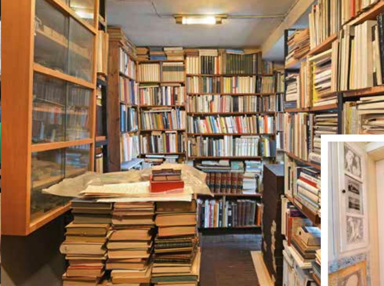
Blick in die umfangreiche Bibliothek des Künstlers.