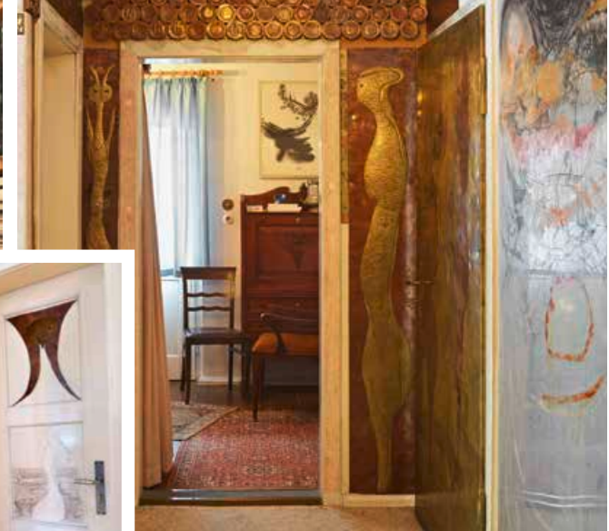
Ornamente und fantasievolle Figuren aus Metall nach Entwürfen des Künstlers verleihen dem Haus seine individuelle Note.