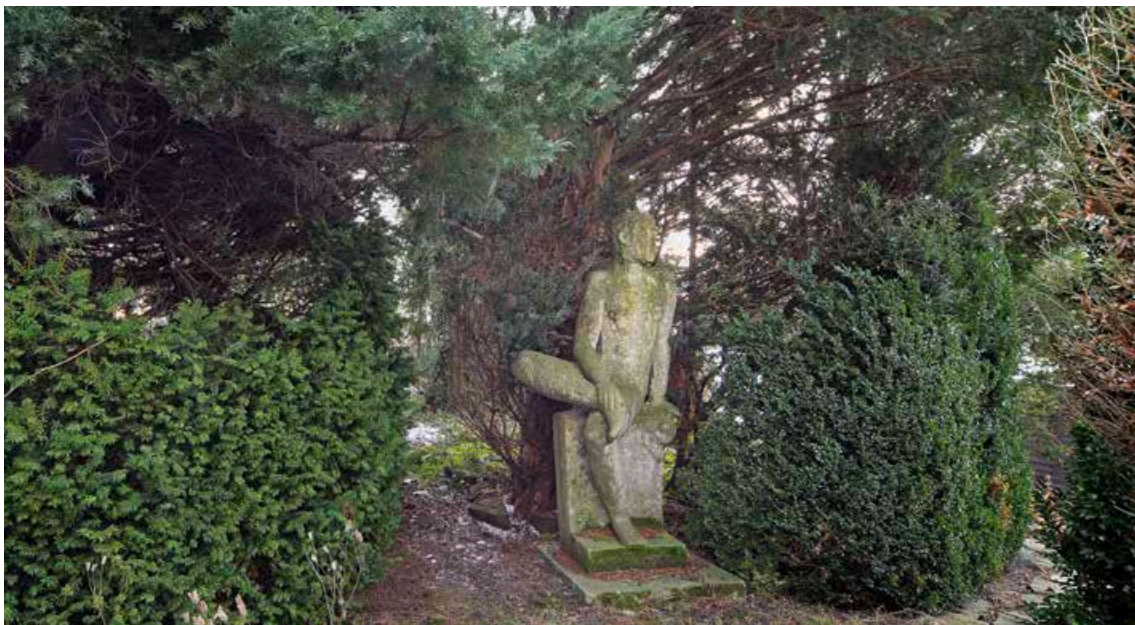
Im Zentrum des Gartens steht der „Jüngling“ von Hans Mettel.

Weitere Informationen unter: www.lindenau-museum.de