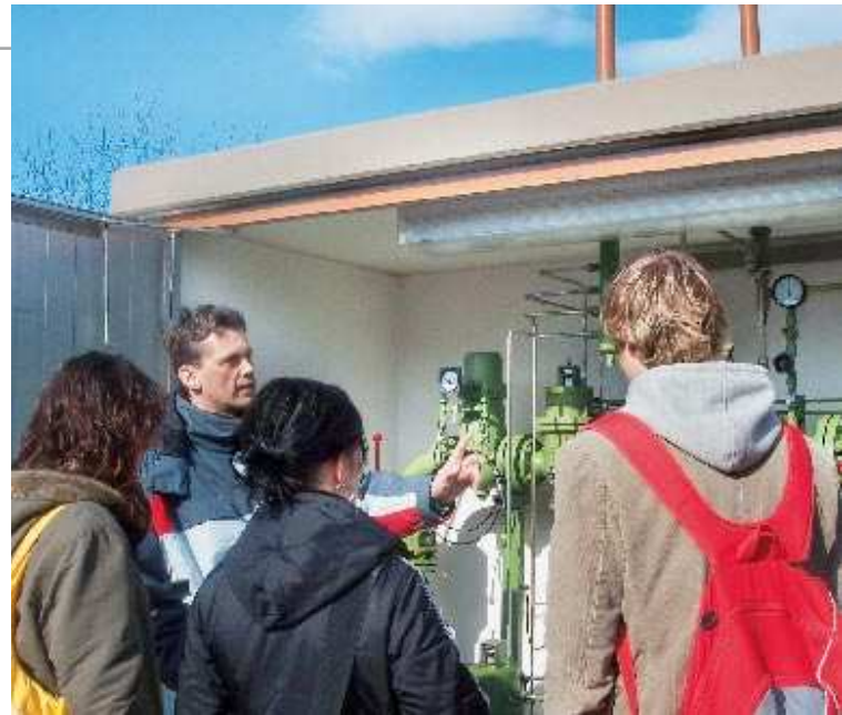
Schüler des Friedrichgymnasiums bekommen die Arbeitsweise der Gasdruckregelstation in der Luckaer Straße erläutert.

kursionen zum Klärwerk Primmeltwitz, zur Gasdruckregelstation Luckaer Straße, in die Blockheizkraftwerke Altenburg Nord und Süd-Ost in die Praxis umgesetzt wurden. Seminarfacharbeiten, die die Themen Energie und Wasser zum Inhalt hatten, wurden von Ewa-Mitarbeitern betreut und erzielten gute bis sehr gute Bewertungen. Zudem wurden Berufsbilder im Unternehmen Ewa und deren Voraussetzungen vorgestellt. Oder es gab Informationen zu Fragen wie zum Beispiel: Wie läuft ein Bewerbungsgespräch ab und welche Kriterien sind wichtig bei einer Einstellung?