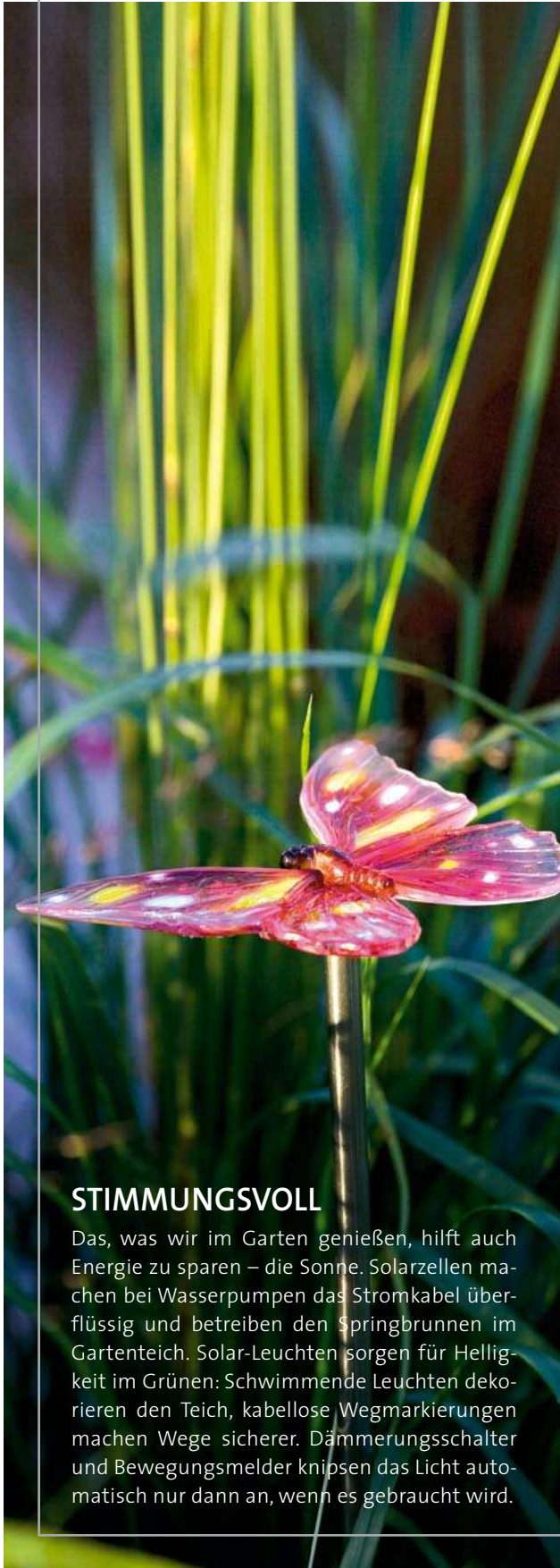
Grosjoe Konstruktive GmbH