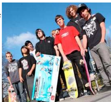
Die Skater freuen sich schon auf die Erweiterung der Anlage Am Großen Teich